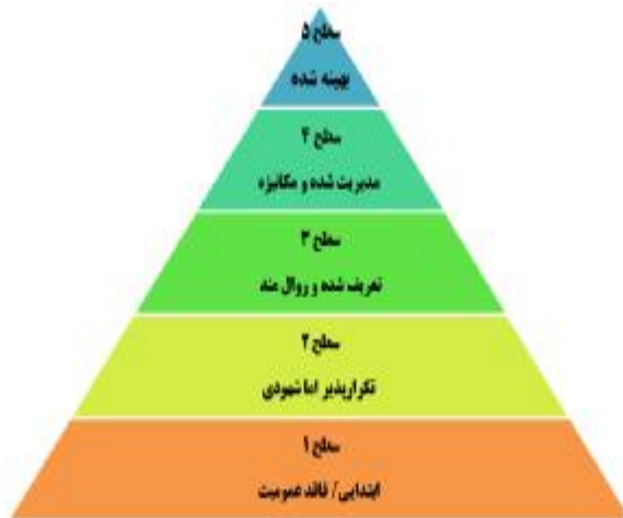
شکل ۵: سطوح بلوغ سرویس بر اساس CMMI [۱۲]

بر اساس استاندارد CMMI۱۸، مدل بلوغ سرویس‌ها در ۵ سطح دسته‌بندی می‌شود [۱۲]. برای مباحث بلوغ سنجی سرویس‌ها از مدلی که در شکل ۵ نشان داده شده است استفاده می‌شود.