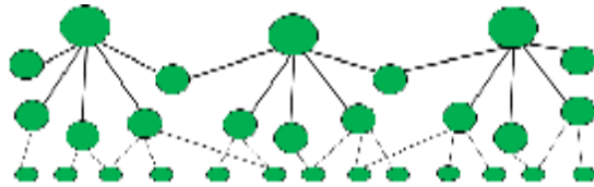
شکل ۴: مدل سرویس (خروجی گرا)

مشخص است که برای درخواست یک سرویس لازم نیست ذینفع از تمامی جزئیات و گردش کار (فرآیند) داخلی سازمان آگاه باشد یا به شرح وظایف و ساختار سازمانی تسلط داشته باشد، در عوض مدل سرویس باید فقط دغدغه‌ها و توصیفات سرویس را از نگاه ذینفع در نظر داشته باشد.