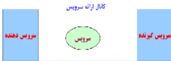
شکل ۱: عناصر مدل سرویس

محدود و شفاف بودن عناصر تشکیل دهنده مدل سرویس از ویژگی‌های مهم آن است. بر خلاف مدل فرآیندی یا مدل‌های سیستمی که از عناصر متنوع و بعضاً پیچیده‌ای تشکیل شده‌اند، مدل سرویس خلاصه و شفاف است. (شکل ۱)